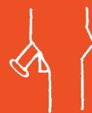
von der Seite