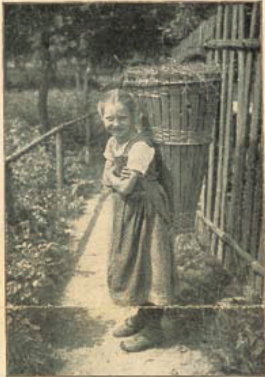
WILH. K. OHLB. DRUCK.