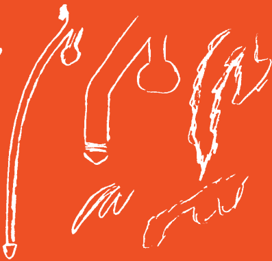
Zeichnungen von hochgradig Triebhaften Patienten (Männerstation)