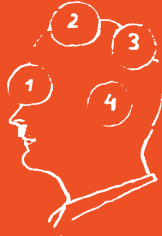
1 bis 4 Wahrnehmung