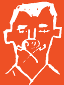
Zeichnungen eines völlig Verwahrlosten